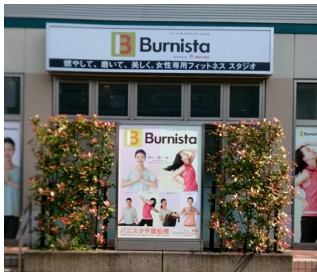
⑨正面の入口からお入りください。

※千歳船橋駅を北口に出たら 線路下高架を右手に 一直線に進みます!! もし、 万が一道に迷ってしまったら・・・ 下記の番号までお電話ください。 スタッフ一同、お待ちしております♪