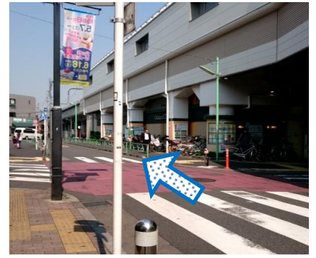
③1つ目の十字路を高架下沿いに進みます。