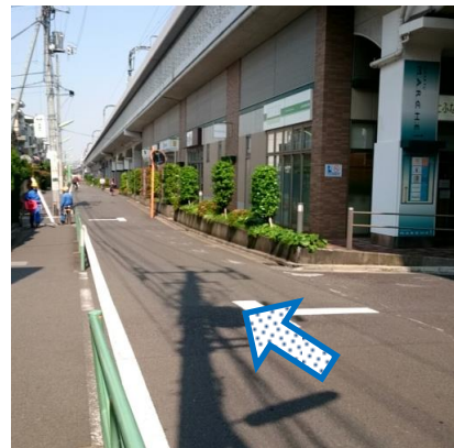
⑦角に、ちとふなキッズクリニックが見えたら2件隣がBurnistaです!!