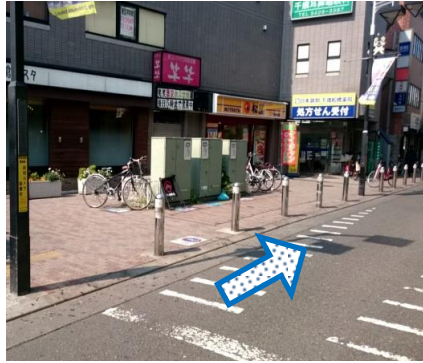
②鎌倉パスタ・松屋さんを左側に直進します。