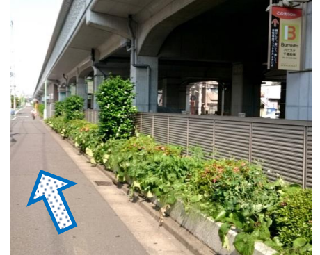
⑥高架下のBurnistaの看板を目安に真っ直ぐ進みましょう。