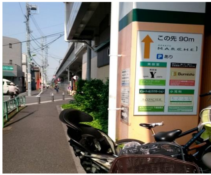
④右側にMARCHEの看板を通り過ぎます。