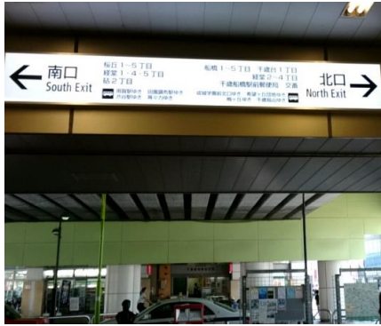
①千歳船橋駅を北口にでます。