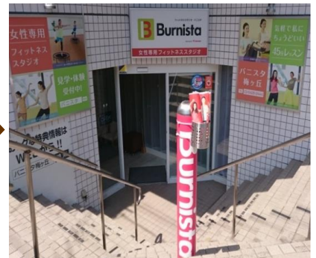
⑨正面の入口からお入りください。