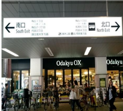
①梅ヶ丘駅南口にでます。