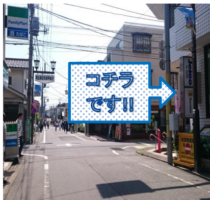
⑧左側にファミリーマートが見えてきたら 向かい側がBurnista梅ヶ丘です!!