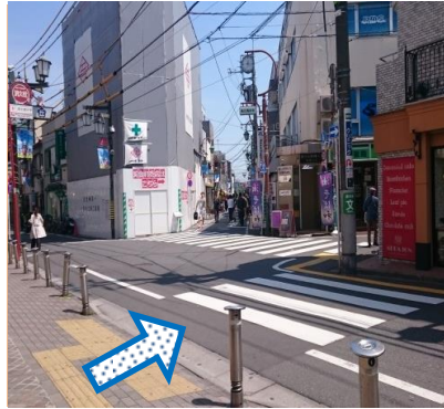
②左側へ進み、 一つ目の横断歩道を渡ります。