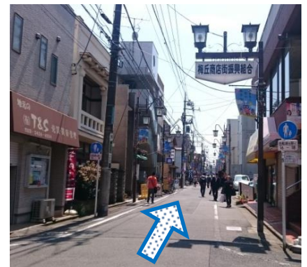
⑥梅ヶ丘商店街振興組合の 街灯沿いに進みます。