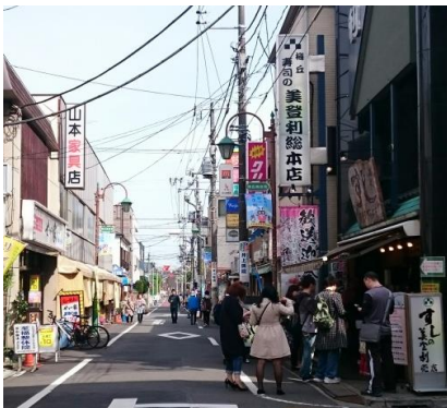
④右側に美登利寿司、 左側に山本家具を通り過ぎます。