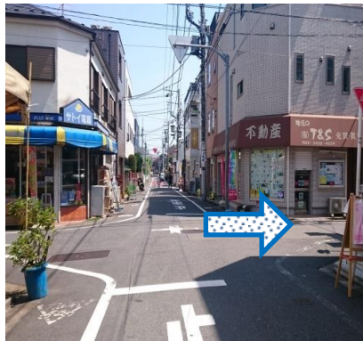
⑤一つ目の十字路を右に曲がります。